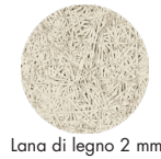
Lana di legno 2 mm