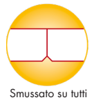
Smussato su tutti i lati